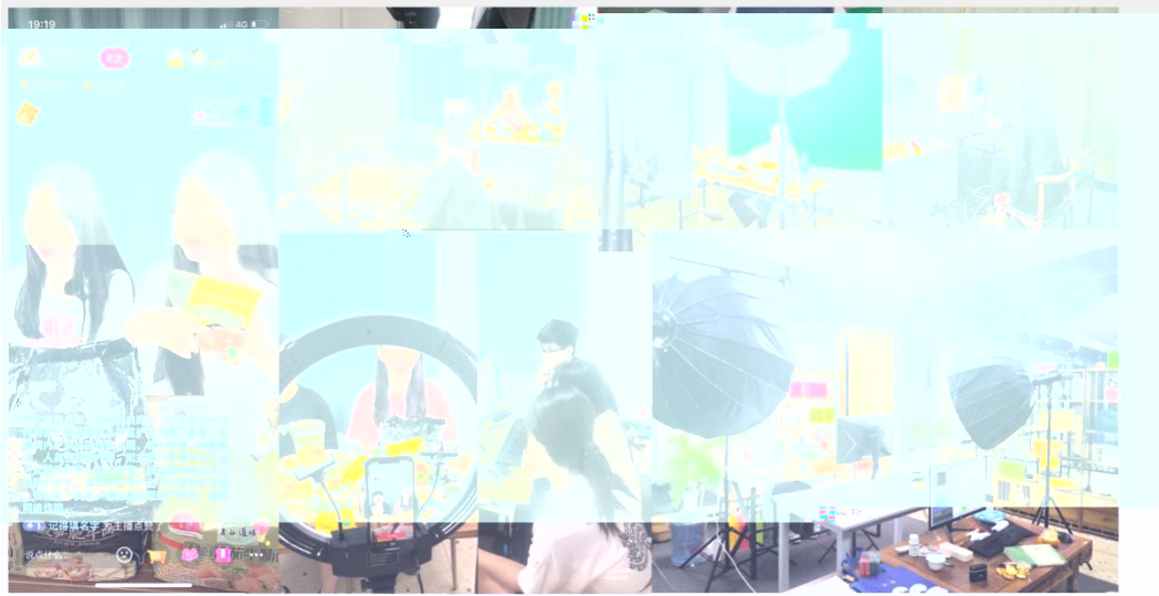
部份学员在进行电商直播实训现场